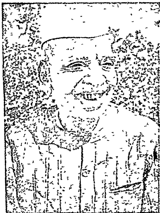
श्री मैथिली शरण गुप्त